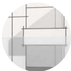
particolare carta interna

Disegno Lucido. Carta da lucido ad alta trasparenza ideale per il ricalco ed il disegno tecnico.